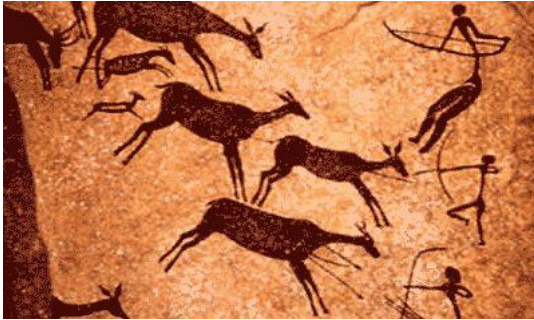
الاقواس والسهام في فن الكهوف

عرف الانسان القديم صناعة الادوات التي تساعده في انجاز اعماله البسيطة الى جانب بعض الادوات المنزلية مثل السكين والفأس ، وتعلم صناعة بعض الآلات الموسيقية مثل الناي من عظام الحيوانات المجوفة كما تمكن من صناعة بعض الادوات التي تقوم على اليات بسيطة يستخدمها في صيد الحيوانات مثل الرماح والاقواس والسهام ، والتي دخلت الى عالم الفنون التشكيلية حين صورها في رسومه التي يرسمها على جدران الكهوف ، حيث صورت جماعات الصيادين الاوائل وهم يطاردون الحيوانات البرية ويطلقون عليها السهام من اقواس بدائية مصنوعة من اغصان الاشجار فيما صنعت اوتارها من امعاء الحيوانات التي يقوم بصيدها (٢٦).