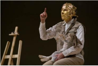
كيف تشرح الصور لأرنب بري ميت؟ ١٩٦٥.

ان استبدال العمل الفني بما فيه من عناصر فنية وقواعد انشائية بفن آخر مغاير يعتمد الجسد كمادة وكموضوع يأتي كردة فعل على التهميش والاقصاء للذات في عالمنا المعاصر. الامر الذي دفع الفنان الى البحث عن موضوعات جديدة للثقافة عوضاً عن ثقافة فنون الحداثة وما قبلها وهو ما اثار جدلاً واسعاً حول قيمة الفن والجمال وفلسفته والية تلقيه. بل تعدى الامر الى ابعاد من ذلك الحد الذي احدث معه تبديلاً هائلاً في النظر الى اهمية المادة والخامة الفنية والتي لم تعد مشروطة بمقاييس معينة الامر الذي منح الفنان حرية واسعة في استغلال تواصلية وسميائية نوع الجسد وجنسه وعمره ، أذ هدف فن الجسد الى زعزعة وضرب البنى التي ينظر اليها في الغالب على انها مهيمانات ومسلطات غير قابلة للتبدل فأستبدلها الفنان بخامات اخرى تجعل من المؤلف غريباً والغريب مألوفاً (١٧) . فضلاً عن ذلك فقد تعددت أساليب فن الجسد وفقاً لرؤية الفنان ومرجعياته المجتمعية والثقافية التي ينتمي اليها. ومن هنا نجد أن الاعتماد على الجسد الأدمي الحقيقي كمادة فيزيقية وفعل تمثيلي يمنح القدرة على الإحساس بإيقاع الزمن الذي يجسد معنى الحركة ويحاكي الواقع من خلال اختزال اللغة التقليدية للعمل الفني