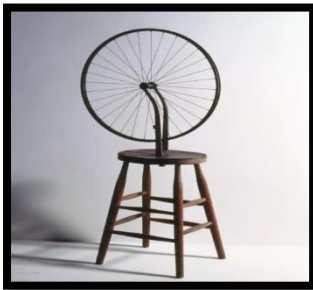
(شكل رقم ٩)

لقد إرتبط الفن الحركي بمجال النحت الحركي والمتحقق من خلال أجزاء متحركة ومحركات ميكانيكية تعمل يدوياً او بفعل طاقة طبيعية، وتعد عجلة دراجة دو شامب هي أول من أسس لهذا الفن الديناميكي ٢٣ ، (شكل رقم ٩).