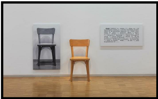
شكل رقم ١

كأعمال لا وظيفة لها او رسالة الا تحقيق ذاتها وتفسير المتلقي، ونرى ذلك جلياً في اعمال الفنان جوزيف كوسوت لاسيما عمله (كرسي واحد وثلاثة كراسي)، (شكل رقم ١) فجعل منه حواراً مرئياً مع ماهية الكرسي ليقوم بتأويلها بمشاركة المشاهدين وإحالة العمل الفني الى Concept يحمل طاقة تعبيرية خارج كل السياقات الاجتماعية، والسياسة والاقتصادية، والثقافية.