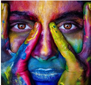
(شكل رقم ٨)

لقد ظهر هذا النوع من التيارات الفنية المفاهيمية عند بعض الفنانين من خلال الحاجة الى الدمج الكلي ما بين الفن والحياة حتى تتلاشى الفوارق بينهما حيث أتخذوا بذلك الجسد كمادة أساسية للعمل الفني، إذ تمثل العمل الفني من خلال حركات تشبه تلك الممارسات الطقوسية البدائية وما يجري في حفلات المدن الدينية في بعض المذاهب بهدف تحريض الجمهور وإثارة انتباههم وتخطي جميع المقاييس والمفاهيم ٢١ .