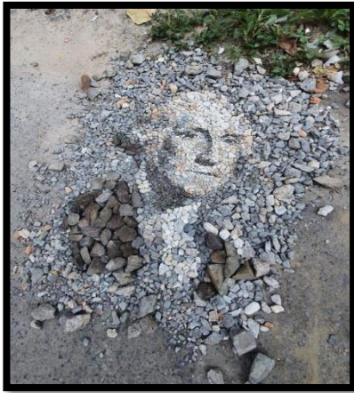
(شكل رقم ٦)

إنشأت هذه المجموعة من قبل عدد من الفنانين المتنوعين علمياً، وقد إستخدم الفنانين المنضويين تحت مفهوم الفن المفاهيمي "الصور الفوتوغرافية، والميكروفيلم، والنصوص المدونة"، واستخدموا أيضاً "مجموعة كبيرة من الكتيبات، والأشرطة المسجلة، و وثائق أخرى تتعامل كلها مع طريقة النقاش حول الفن ١٨ .