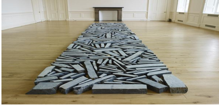
(شكل رقم ٧)

العمل الفني فيه يشترط وجود الطبيعة فيتداخل معها و يندمج مع البيئة المحيطة به كما ويسمى ايضاً (بالفن المستحيل)، لكونه ينفذ بمساحات كبيرة مستمداً عناصره من الطبيعة، ومن ابرز فناني هذا التيار الفنان ريتشارد لونغ (Richard Long)، وهو نحات بريطاني وفنان بيئي ٢٠ (شكل رقم ٧).