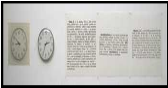
(شكل رقم ٥)

يمثل هذا الفن نقطة إلتقاء ما بين مناهج عدة، منها مناهج إتصالية، فالصورة واللغة تلتقيان في الكتابة، كذلك الوسيلة التي تجعل من الكلمة مرئية، غير ان الجمع بين كلمتي فن ولغة لا يشير إلى "ممارسة الكلام بإعتباره فناً، بل إلى تطبيق اللغة على تحليل الفن ١٧ . وذلك ما يسمى بالفن التحليلي الذي يشابه التلاعب بالألفاظ والذي عرف به دوشامب، وقد إكتفت هذه المجموعة بإستبدال المشاهد المصوّرة إلى وصف مكتوب يعلق في صالة العرض الفني للأعمال الفنية (شكل رقم ٥).