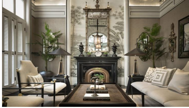
شكل (٤) يوضح استخدام الرموز التقليدية للحضارة الصينية في تصميم فضاء

بحيث يكون هناك تقليد ثقافي معين، على أساس الوظيفة والتكنولوجيا الحديثة على الاستمرار والتطوير. على سبيل المثال: فان الكولاج الرمزي، له خصائصه والتي تستند الى المكون التقليدي المألوف للتجريد أو التكسير أو التشوه، مما يجعل بعض العلامات النموذجية أو الرمزية، وفي العناصر الداخلية للكولاج قيد الاستخدام، بحيث يكون الجديد والقديم والحاضر مع ارتباط متناغم. في التصميم، يمكننا أحيانًا استخدام بعض عناصر الحضارة الأجنبية والعناصر الحضارية المحلية التي ولدت في واحدة من الحقب التاريخية. وكما موضح في الشكل التالي: