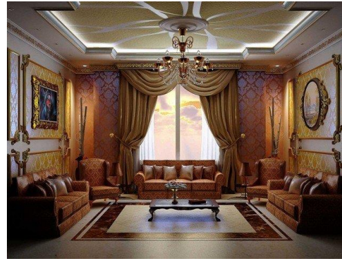
شكل (٣) يوضح بعض انواع تصميم الفضاءات الداخلية والمتاثرة بالهوية الحضارية الاسلامية ويتصميم معاصر https://www.luxurious-studio.com/guide-to-modern-arabic-interior-design/