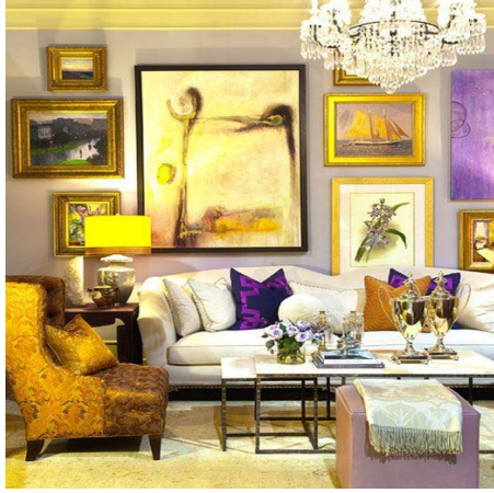
شكل (٦) يوضح اختيارات البنفسجي والذهبي في تصميم الفضاء الداخلي https://www.pinterest.com/pin/58617232621454519/