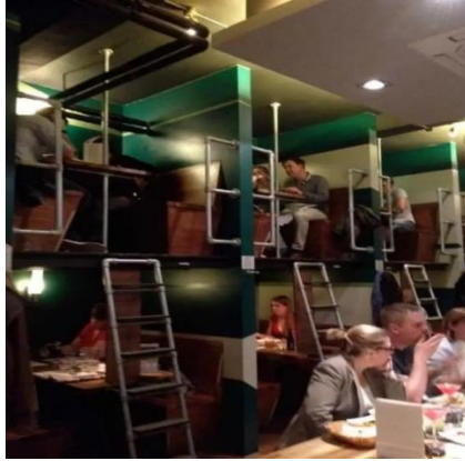
شكل (١) يوضح احد التصاميم السيئة لفضاء داخلي لمطعم

يمكن أن تشير البيئات (المساحات) إلى مجموعة من الأنشطة التي يمكن أن تحدث أو لا يمكن أن تحدث ولديها القدرة على إثارة المشاعر. إذ أن الجودة المرئية المتصورة للأماكن لها تأثيرات قوية على التجارب البشرية. ويمكنها المساهمة في إنتاجية العامل، وحالة سلوك المستخدم الذهنية والرفاهية العامة للأفراد. وتشير الدراسات إلى أن الجودة المرئية تحظى بتقدير عالٍ لدى الأشخاص. إذ يعطي معظم الأشخاص الجودة البصرية أهمية أكبر من الجوانب الأخرى لمحيطهم، ويمكن أن يؤدي المظهر المادي غير المتوافق مع الصورة المرغوبة إلى تجنب الأشخاص لمكانًا ما. على سبيل المثال، قد يتجنب المستخدم المكان إذا كان ينقل إليه معنى غير مرغوب فيه. إذ يوضح Perolini مثالاً لمطعم غير مألوف (شكل ١). إذ يكون العملاء أحكامًا من خلال دخول المساحة من مظهرها مما يتيح لهم وضع افتراضات حول السعر وجودة الطعام والخدمة. ستؤثر هذه الأحكام أيضًا على سلوك المستفيدين. يحتاج المصممون الداخليون إلى أن يكونوا قادرين على التنبؤ بهذا التصور والتوصل إلى حلول تصميم تنقل المعنى المطلوب. يحتاج المصمم الداخلي المدرب إلى أن يكون قادرًا على قراءة كيفية تقييم المستخدمين للبيئة وما المعنى الذي قد يراه المستخدمون المحتملون فيها ٢٦ .