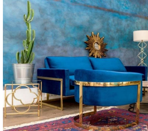
شكل (٥) يوضح اختيارات الأزرق المخضر والذهبي في تصميم الفضاء الداخلي https://deavita.net/blue-and-gold-interior-design-ideas.html