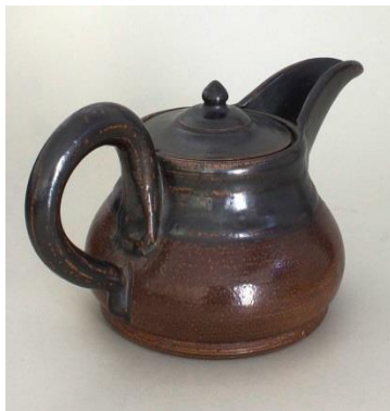
الشكل ( ٨٦ )