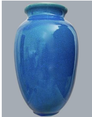
الشكل ( ١١٤ )