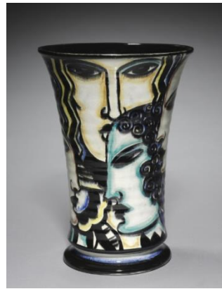
الشكل ( ٨٢ )