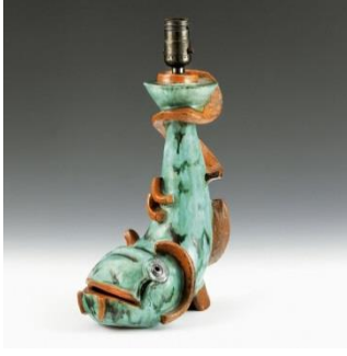
الشكل ( ٨٩ )