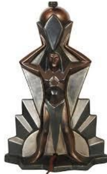
الشكل ( ١١١ )