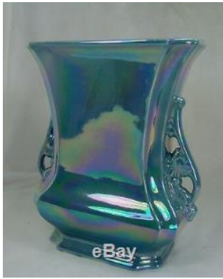
الشكل ( ١١٥ )