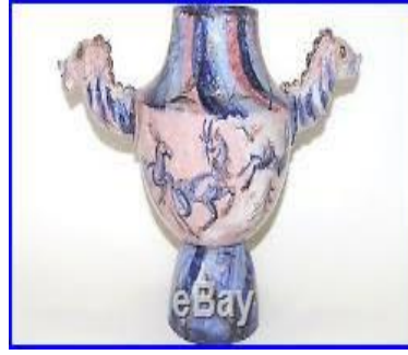
الشكل ( ٨٨ )