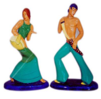
الشكل ( ١١٠ )