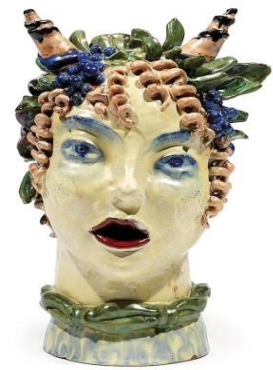
الشكل ( ٨٤ )