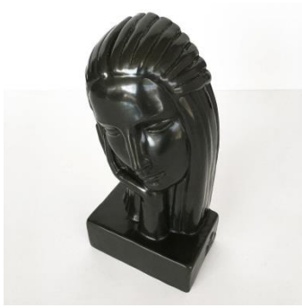
الشكل ( ١١٢ )