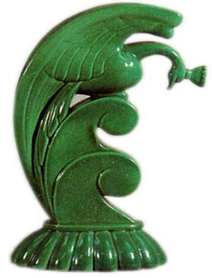
الشكل ( ١١٣ )