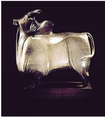
Brahman, 1951 Glazed earthenware, 21-1/2" x 26" x 9-1/2".