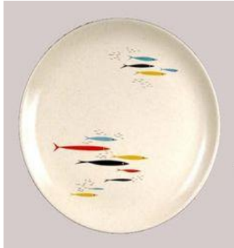
الشكل ( ٨٠ )