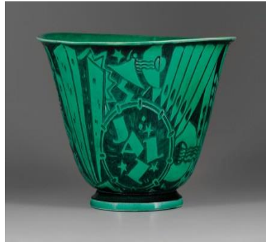
الشكل ( ٧٩ )