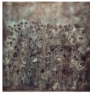
الشكل رقم (١٠)