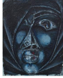
الشكل رقم (٩)