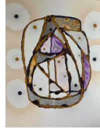
الشكل رقم (١٥)

وابتداءً من الخط واللون شكلت الفنانة وسائط التناسق والتوازن والتناسب بين الكتلة والفراغ وكيفية إيجاد إيقاع لوني بين المتضادات اللونية والتباين فيما بينها منسجمة ومتسقة مع بعضها رغم تعددها لتعطي دلالة مجردة ، حيث عملت الفنانة انمار مفردة تجريدية رمزية احادية ، اذ أنه من المجازفة والمغامرة ان يجسد اي فنان مفردة رمزية احادية ليشغل عليها .