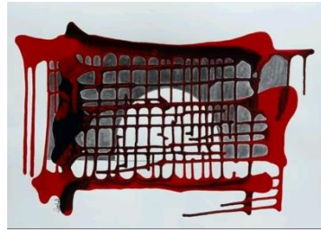
الشكل رقم (١٦)

اما الفضاءات تبدأ بالموقع العام والتشكيلات الخارجية ثم الامتداد الى الداخل وهي الدائرة لتدخل في دوامة دائرة اخرى داخلها نقاط متجاوزة شاخصة ، وهناك نقطة مركزية تجمع كل تلك القوى المتحركة فوقها الى مركز وعمق اللوحة والثيمة وهي النقطة التي نشاهدها في جميع اعمالها كما في الشكل رقم (١٥) (١٦) .