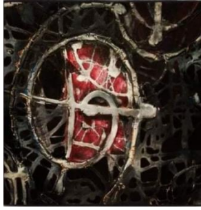
الشكل رقم (١١)