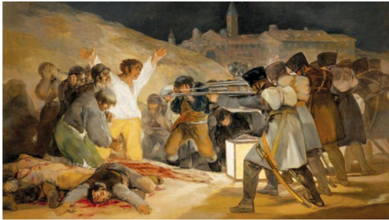
(شكل - رقم ١)

المجازر التعسفية التي ارتكبتها القائد الفرنسي نابليون بوناپرت في إسبانيا ، فقد تسبب بقتل ودعس كل من يقف أمامه ٩ ، تعرض اللوحة الان في متحف ديل برادو بمدريد .