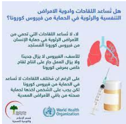
شكل (٥) يوضح بلاغة النصوص الكتابية وتوافقيتها مع دلالة الاشكال

فالهدف الرئيس من الرسالة الانفوجرافية هو توصيل فكرة التصميم التوعوي الصحي بأبكر قدر ممكن من البساطة والوضوح الى المتلقي، ويجب (ان تكون الرسالة بصورة مبسطة وان تعني الكلمات نفس الشيء بالنسبة للمرسل والمستقبل والمواضيع المعقدة يجب ان تكثف الى شعارات وصور إلى جانب النص بطريقة مقبولة) (١٥) . كما في الشكل (٥)