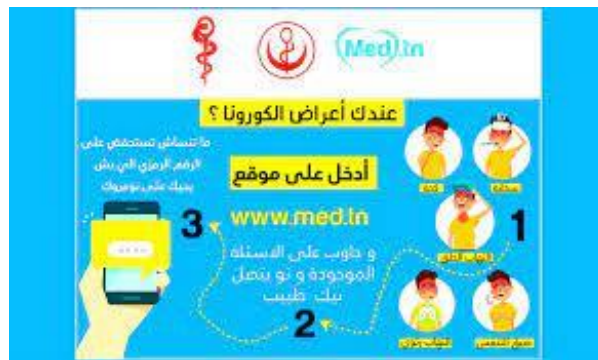
شكل (٦) تتمظهر القيم اللونية للرسوم بجاذبيتها البصرية لتوعية الافراد والمجتمع

تصميم تبنته وزارة الصحة العراقية مصمم ومدعم من قبل نقابة الصيدلة وشركة ميد للأدوية في العراق مع وزارة الصحة العراقية يدعو الى توعية الافراد والمجتمع بالاتصال السريع عند وجود اعراض تم تحديدها ووظفت الرسوم