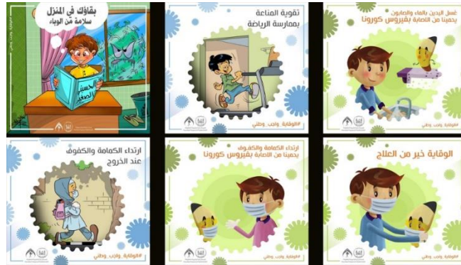
شكل (٢) يبين الصور كرسوم ارشادية توعوية صحية

بحسب رأي الباحثان فإن الصور والرسوم في تصميم الانفكرافيك تعد عملية تنظيم يقوم بها المصمم والمتمثلة بالمتغير الوظيفي أي التعبير عن مهمة وهدف تصميم الانفكرافيك عبر الاثارة وهو هدف يركز عليه الجانب التوعوي الصحي في جذب النظر والانتماء والهوية الذي يتحقق فعل الاشكال والصور والرسوم لتعبير عن الحالة الاجتماعية عند وضع فكرة الصور والاشكال في تصميم الانفكرافيك.