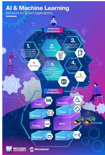
شكل (٣) يوضح مستوى التخيل للأشكال في الانفوكرافيك

تستنتج الباحثتان مما تقدم: ان الجانب النفسي في وظيفة تصميم الانفوكرافيك هي جذب انتباه المتلقي أولاً التي تبدأ من نقطة معينة ثم تتحرك تبعاً وحسب الاهمية لباقي العناصر المكونة لتصميم الاعلاني، وهنا يختلف تلقي الشكل المصمم بين افراد المجتمع الواحد إذ إن الانماط المختلفة من البشر يختلفون في اختياراتهم وادراكهم وتفسيرهم لرسائل الاتصال الانفوكرافيك مما يعني ان العوامل النفسية يمكن ان تؤدي دوراً أساسياً ومهماً في توجيه بصر المتلقي نحو محتوى التصميم المحدد.