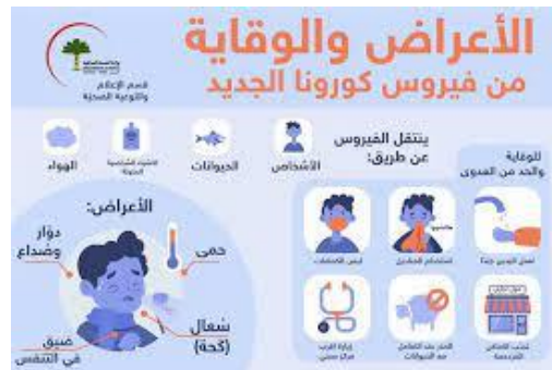
شكل (٤) يوضح الصور كرسوم ارشادية توعوية للوقاية من فيروس كورونا

امتلاكها قيمةً فنيةً وجماليةً لتحقيق عامل الجذب. ( إذ تستعمل الصور غالباً في جذب نظر المتلقي وشد انتباهه الى الانفوجرافيك لما لها من تأثير مباشر وفعال في عملية الاتصال البصري فالصورة تعطي الموضوع تجسيداً وتقرب للمتلقي الفكرة وتشارك الصورة مع العنوان لتحقيق الوضوح والجمالية وكسر جمود المادة المكتوبة (١٣) . كما في الشكل (٤)