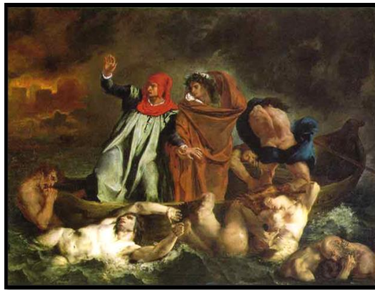
شكل رقم (٢)

فقد كانت اعمال الفنان ديلاكروا تزخر بالألوان وممتلئة بالحركة والعاطفة فعمد الى تكييف حركة الجسم الإنساني في اثار الفن بالانفعالات المتوهجة في النفس البشرية، ففي لوحته الفنية (قارب دانتي) اعطت الاجساد الموجودة على اللوحة روحا صارخة للحدث، فهذه الأجساد تخوض ملحمة صعبة، فبانث منهكة ومتعبة لا تملك القدرة على التفاوض وهي تبدو مذنبه ومنزوعة النقاء والبراءة (٢١) .