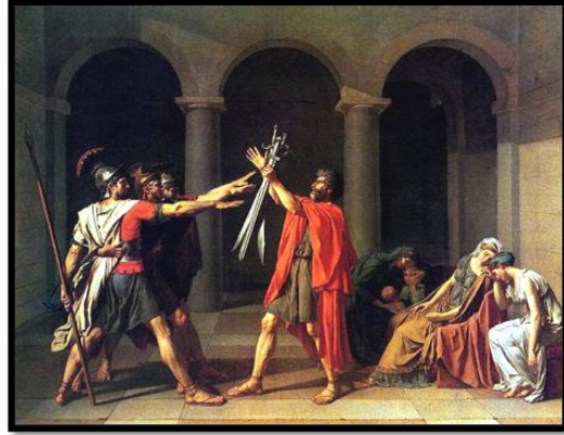
شكل رقم (١)

ومن اهم ممثلي هذا التيار هو (لويس دافيد) الذي يعد أبا التيار الكلاسيكي ومؤسسه، فقد كانت لوحات الرسام دافيد تتخذ من الشكل البشري وحدة أساسية للتعبير عن الاحداث والمشاعر والأفكار، اما الطبيعة فيتضاءل شأنها الى جانب الشكل البشري، اذ كان ينظر الية بوصفه القوة التي تسيطر على الطبيعة (١٦) . وقد انتج (دافيد) عددا من اللوحات التي التزم فيها بالمبادئ الكلاسيكية ومن اشهرها لوحة (قسم الاخوة هوراس) فقد التزم بها وغيرها من الاعمال بمبدأ الوضوح في التعبير عن الواقع وفي ترفع عن عرض المشاهد الدرامية، واستخدم أسلوب يحرص على رصانة الخط والرمز بشكل الانسان في حركات وأوضاع نبيلة (١٧) .