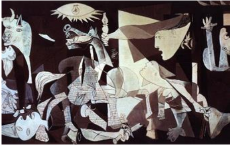
شكل (٨) والدة الفنان على الشرفة

ورسومات امبرتو بوتشوني (١٨٨٢-١٩١٦) امتازت بدراسة حركات الجسم البشري، فهو يجمع في رسومه بين البيوت والأجسام الحية من إنسان وطير كما في لوحته والدة الفنان على الشرفة شكل (٨) المرسومة عام ١٩١٢ ففي اللوحة والدة الفنان على الشرفة وهي تلقي نظرة على الشارع في الأسفل وقد عبر عن وجهات نظر متحولة والأشكال متشظية لتمثيل واقع اجتماعي تملؤه السرعة والعنف والحركة الديناميكية. (٤٢)