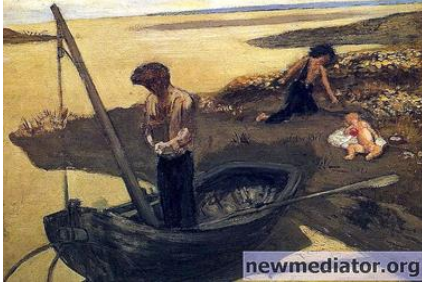
شكل (٤) الصياد والمسكين