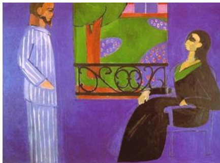
شكل (٦) الاصدقاء

ونجد الفنان أوسكار كوكوشكا ( ١٨٨٦ - ١٩٨٠ ) اهتم بالواقع الاجتماعي وعكس مدى تأثره بأحداث عصره وفي مدينتي براغ ولندن شارك في الجمعيات المناهضة لنظام هتلر اذ كان محافظا على موقف عدائي صارخ على جميع انواع العنف والطغيان، وبالنتيجة فقد شوهة وجوه شخصياته بتعابير عصبية وحالات نفسية لما لاقته من الاحداث الحياة والمشاكل الاجتماعية كما في لوحته الاصدقاء شكل (٦) اذ تبدو شخصياته متطرفة ينتابها انفعال معين من كل وملل وصراع وازمات معبرة عن مشاكل المجتمع السياسية والاجتماعية. (٣٦).