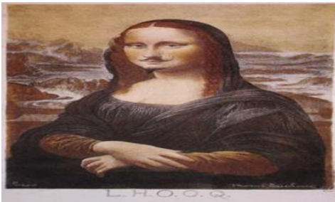
شكل (١٠) الموناليزا

وقد صور مارسيل دوشامب (١٨٨٧ - ١٩٦٨) بشكل معبر عن الاوضاع السائدة في المجتمع الاوربي وما لاقاه من ويلات ودمار واضطراب وتبدل للافكار والمفاهيم ، اذ اصبحت المرأة تشاطر الرجل بأعماله تاركتا البيت والاطفال، لذا عمل على وضع شاربا لها وابدل الانوثة بالذكورة كما في لوحته (الموناليزا) شكل (١٠)، مما حاكا الواقع المستلب البعيد عن المظاهر الخادعة والمزيفة واطهار الحقيقة على الرغم من عدم مألوفيتها او عدم مقبوليتها من البعض. (٤٨)