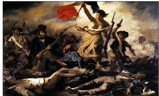
شكل(١) الحرية تقود الشعب