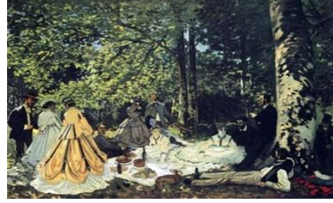
شكل (٣) الافطار على العشب

ومع بداية القرن العشرين تركزت النشاطات الفنية في اوربا في مدينتي باريس وميونخ ، اذ كان الطريق في باريس مفتوحاً لنمو وظهور قيم ومفاهيم وأساليب وتقنيات جديدة مهدت لظهور الوحشية وهي كتيار فني تعود جذورها إلى نهاية القرن التاسع عشر، لكن لم يعرف هذا التيار بهذه التسمية الوحشية إلا بعد عام ١٩٠٥، وهي من الحركات المؤثرة في الرسم الحديث والتي تركت ظلالة عريضة على عملية النمو الذي شهده الرسم الأوربي. (٣١)