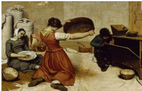
شكل(٢) ناخلات القمح

ويرى زعيم النزعة الواقعية غوستاف كوربيه(١٨١٩ - ١٨٧٧) ان الواقعية تجسيدا لما ندركه ونشاهده من واقع الحياة اليومية فينفذ بذلك الى حياة الاسرة ويعالج مشكلاتهم ويبصر بالحلول وجسد في لوحاته وبشكل مجازي ابعادا اجتماعية بواقعية مفرطة للدلالة على احتقاره للطبقة البرجوازية وتمجيده لطبقة العمال والفلاحين كونهم يستحقون الحياة والتقدير ففي عمله ناخلات القمح شكل (٢) تعبيرا عن حالة الالم والبؤس في اوساط عامة الشعب مع انه مشهد عائلي مرتبط بنوع من التعبير الموضوعي أي سعى الفنان الى تصوير الموضوعية التي تنكش امامها الصفة الذاتية وان يختار موضوع من واقع الحياة اليومية.(٢٤)