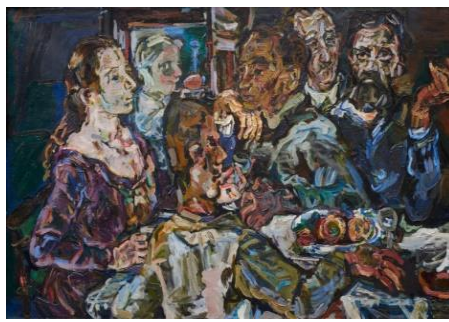
شكل (٥) هنري ماتيس

وفي ظل التطور العلمي والتكنولوجي الذي تحقق في ميادين الرياضيات والهندسة والكيمياء البلورية ومنها طروحات أينشتاين ونظريته النسبية انبثقت رؤية متحررة واسلوب جديد في بداية القرن العشرين اطلق عليه (التكعبية) ، اذ اكدت هذه المدرسة على نظرية التبلور التعدينية التي تعد الهندسة اصل الاجسام فهي ترى ان الحقيقة التامة تأخذ كمالها وابعادها الكلية عندما تمتلك ستة وجوه كالمكعب تماما. (٣٧)