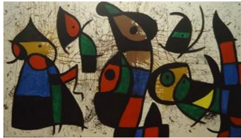
شكل (١١) جماليات الفوضى المنظمة

وقدم الفنان الأسباني (خوان ميرو) (١٨٩٣ - ١٩٨٣) اعمال سريالية تشير الى واقع الانسان تقوم على اسلوب التلقائية اللاشعورية، اذ يبدأ الرسم دون تخطيط مسبق وبغفوية وطلاقة مبهمة حتى تظهر الصورة ذات واقع جديد مليء بالغرابة والخيال والرمزية القوية، وجسدت لوحته(جماليات الفوضى المنظمة) شكل (١١) مفاهيم إنسانية غارقة ببيئة غريبة، فهو يعالج العلاقة بين الإنسان والطبيعة لإظهار الفوضويات التي تملئ المجتمع ومتخذا منها حافزا في تقدم الحياة الاسرية.(٥١)