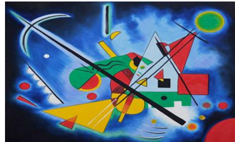
شكل (٩) كاندنسكي