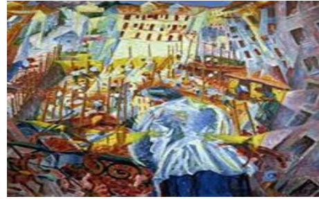
شكل (٧) الجورنيكا

ونظراً لما جاء في القرن العشرين من تحول في أنشطة المجتمع الاوربي وما لمسها الإنسان في هذا العصر من طغيان المادة على كل شيء واستبدادها بحياة الناس وتفكيرهم وتحديدها لقيمهم وتوجيهها لسلوكهم فأراد أن يضرب بمعوله في هذا الصنم الذي صار في هذا القرن هو الإله المعبود وان يرد الإنسان إلى قيمه الروحية ومثله العليا ، ونتيجة لذلك ظهرت حركة فنية جديدة في فرنسا عام ١٩١٠ سميت بالحركة التجريدية الذي اوجدت مفهوم جديد للإنسان وعلاقته بالعالم اذ حلت الفكرة محل الصورة والتسامي والزهد للوصول الى حقيقة اكثر صدقا ، حقيقة تنبثق من فعل الروح المستقل (الحقيقة الذاتية). (٤٣)