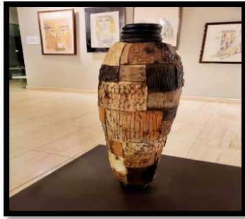
شكل رقم (٤)