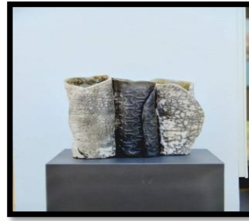
شكل رقم (٣)

ويتنوع الانتاج الفني من خلال هذا المنطلق بخبره الخزاف في الكتابة والخط لتتباين وتتداخل الأسطح والمستويات في نحوت خزفية بارزة ذات هيئه حرة تتوافق مع امتلاء الشكل.. وعالم التنوع ليذهب الي علاقات كونه للتعبير عن الحركة والديناميكية والاستمرارية في بناء الشكل النحتي الخزفي بناء فيه الحيوية وقوه البناء واتجاهات حركه السطوح والخطوط وتلاقيها حول الكتلة في الفراغ للتجاوب جماليا وبفاعليه مع اخلاف حركه الشكل وهيئه وتفاعله مع الضوء وتكوين الظلال المتغيرة والمتنوعة الغير ثابتة مع حركه ادراك الشكل للمتلقي حالة يدركها الخزاف.. ويستمتع بها بصريا للمشاهد دون افتعال تنوع مستمر مع اعمل تحمل رؤية جديده لما هو مألوف ومتوقع لأشكال وظيفيه جمالية يحمل رؤيه خاصه في ايجاد معادل بصري جديد للنبات مستفيد من قانون نموه في بناء اعماله ليكون التكامل بين الشكل وحركته.. عالم متفرد بين البناء النحتي واصول فن الخزف والرؤية