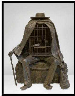
( الشكل ٣ )

استخدمت الحركة السريالية طريقة الأوهام المكانية ، وأحياناً نجد أعمالاً نحتية ذات قوة تصويرية مفرطة ، تبلور مظهر الأشياء ، وأجسادها تقف في عالم غريب على حدود الوعي واللاوعي. تعطي السريالية الفرصة لاكتساب معنى جديد من خلال استخدام بعض حالات الأحلام المنتشية والمجنونة. بالإضافة إلى العبارات الخادعة والحوارات مع عناصر متنافرة غير مألوفة ، هنا يلجأ إلى ما يسميه النشاط الوهمي النقدي ويعتبر مقارنة تلقائية للمعرفة غير العقلانية ، لقد لاحظنا أن بعض موضوعات النحت السريالي هي تحويل العمل النحتي إلى بنية رسمية وغير منطقية من خلال مبادئ الفن السريالي (من خلال دمج عالمين من الواقع ، أو الخيال في الجمع بين نظامين من الشخصيات ، الواقع والخيال (٢٣)، مثل (الشكل ٣)