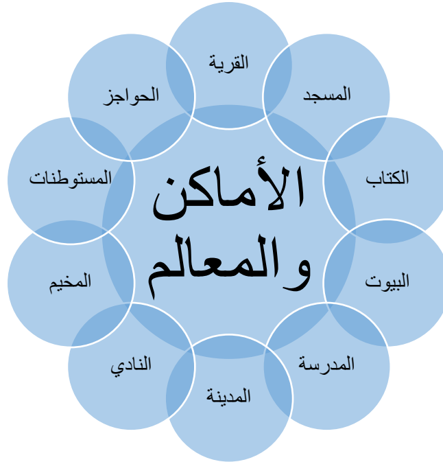
الشكل رقم (٢) الأماكن والمعالم في المسلسل

ومن أبرز هذه الأماكن والمعالم التي تضمنها ما يوضحه الشكل الآتي: