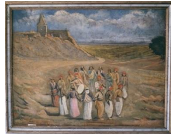
شكل رقم (٥)