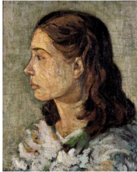
شكل رقم (٤)