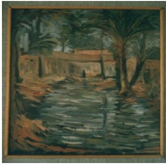
شكل رقم (٢)