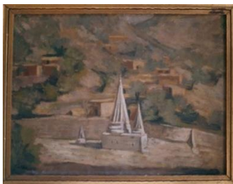
شكل رقم (٦)