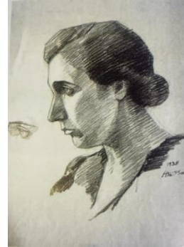
شكل رقم (٣)