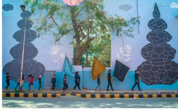
صور رقم (٢): الفنان: Andreco اندريكو

مثال آخر على مشروع ناجح قدمته موقع منظمة Ocean Sole Organization (O S O) يستخدم الفن لتعزيز الحفاظ على البيئة هو المنظمة الكينية غير الحكومية Ocean Sole. وجدت المنظمة طريقة مثيرة لحل مشكلة غريبة: التخلص غير السليم من الصنادل المطاطية على ساحل البلاد . تستخدم O S O هذه الأحذية لإنشاء منحوتات للحيوانات، بالإضافة إلى الألعاب والأواني الأخرى. بدأت المبادرة مع عالمة الأحياء جولي تشيرش Julie Church، التي لاحظت في عام ١٩٩٩ أن الأطفال من Kiwayu، وهي جزيرة تقع قبالة الساحل الشرقي لكينيا، كانوا يرتدون الصنادل القديمة لصنع الألعاب. ثم بدأت جولي صورة رقم (٣) في تشجيع أمهات هؤلاء الأطفال على جمع هذه المواد التي تلوث المحيط. في عام ٢٠٠٥، أسس رجل أعمال منظمة Ocean Sole، الذي يشتري الأحذية المجمع ويحولها إلى منحوتات جميلة مع عدة فنانين. تقوم الشركة بالفعل بإعادة تدوير أكثر من ٥٠٠٠٠٠٠ نعال مطاطي سنويًا، ويعمل بها حوالي ٩٠٠ كيني في جميع أنحاء خط التجميع والإنتاج.