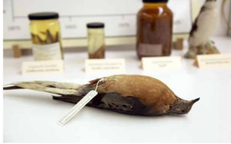
صورة رقم (١): حمامة الزاجل، متحف بورك للتاريخ الطبيعي والثقافة، الكتالوج رقم UWBم ٦٨٧٨. غالبًا ما يدرس الفنانون عينات المتحف في تخزين المجموعات لإلهام عملهم وتوجيهه. المصدر: (١٦)

لا يزال جزء من المجتمع يهمل القوة التحويلية للفن؛ لذلك يجب أن نستمر في تثقيف أنفسنا حول استخدام الأدوات الفنية لخلق وعي اجتماعي وتحويل مجتمعاتنا. فيما يتعلق بالمشاريع التي نقدمها للبيئة من خلال الاعمال الفنية المؤثرة، وكيف ملاحظة تأثيرها أيضًا على واقع المجتمعات مع الحفاظ على البيئة. من خلال تنشيط الأماكن العامة بالفن الحضري أو توظيف أفراد المجتمع، فإن الفن لديه الكثير ليساهم في تطور المجتمع. ذكرت دراسة جين Jeanne بعنوان "دور الفنون البصرية في منع الإتجار بالحياة البرية" ان المشاركون بستة من اثنتي عشرة صورة شاركها الفنانون الذين تمت مقابلتهم، بما في ذلك العديد من أعمالهم الخاصة. بالنسبة للصور الست وهي: الحيوانات الأليفة الغريبة، الحيوانات البرية، الحيوان مهدد بالانقراض وحيد القرن والنمر. (١٧). كم في الجدول التالي: