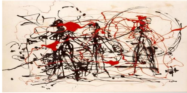
الشكل رقم (١) لوحة الأقطاب الزرقاء رقم (١١) عام ١٩٥٢ الشكل رقم (٢) جاكسون بولوك داخل العمل الفني