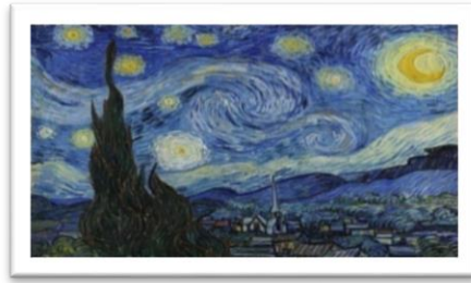
شكل رقم (١)

التعبيرية : هي حركة فنية تسعى الى التعبير الفني عن الحياة مستتدة بذلك على الجانب الذاتي الا وهو الانسان فقط وهذا ما يجعل الفنان التعبيري يعبر عن الازمات الذاتية ويسقطها على سطح العمل الفني . (الحاتمي الاء علي عبود : تجليات التعبير الفني في الرسم الاوربي ، ط١ ، دار الرضون للنشر ، عمان ، ٢٠١٤ ، ص٩٢ وبتقوية عنصر التعبير ، تقوى الصلة بين الفنان وعمله الفني ، فالتعبير يمثل العنصر الانساني في الفن . بقدره الشحنة العاطفية تتحول الصور الى رموز ساحرة . تكشف عن ثقافة الفنان ويود المتلقي أن يشارك احساس الفنان خيالياً . فيتناول الفنان المستوى الرمزي ، فتبدو له مثل كائن يحس . بما تحمل من فرح وحزن فتولد نوع من السحر الايحائي . يحدد علاقة الفنان بالأشياء . وهكذا يتخذ الفن سبيلاً للتعبير الشخصي عما يجول في خيال الفنان وفي وجدانه . فيتضمن الفن الانفعالات صورت بالأبعاد الرمزية من خلال اللون او خط فيمكن الحصول على حالات الشعور ، مثل المرح والحزن من خلال اللون او الخط واستطاع (فان جوخ ) ان يوحي من خلال مناظرة التي رسمها بأفكار عاطفية تحمل سمات تعبيرية كما في الشكل رقم (١). (١٨)