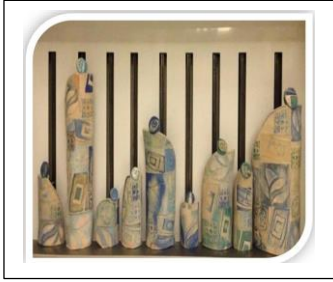
الشكل رقم (٢)

والفن في المملكة مثل غيره من الشعوب الاخرى . لكنه يهتم بالتعبير عن القيم والمفاهيم العامة في مجتمع عربي كما في الشكل رقم (٢) .