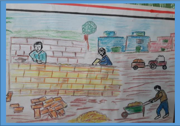
عينه رقم (٤)