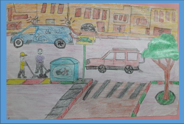
عينه رقم (٢)