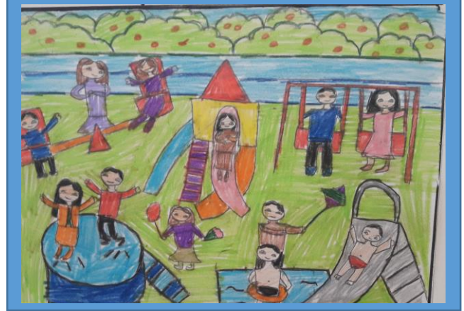
عينه رقم (٣)