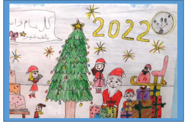
عينه رقم (٩)