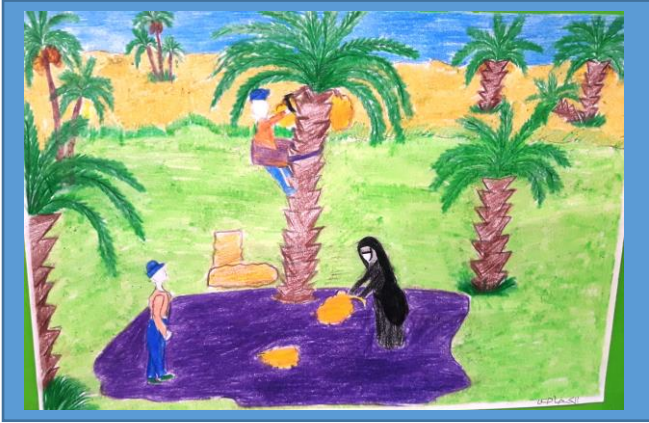
عينه رقم (١٠)