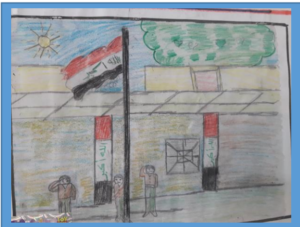
عينه رقم (٦)