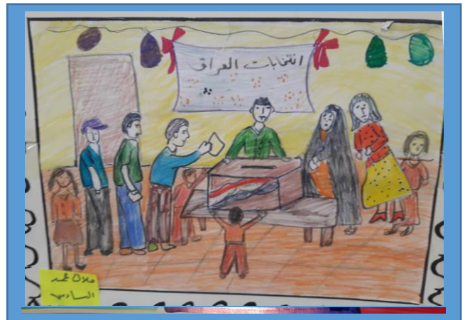
عينه رقم (٥)