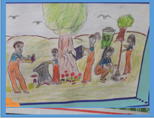
عينه رقم (٨)