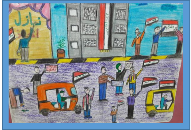
عينه رقم (١)