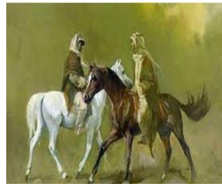
شكل (٥) لوحة للفنان (فائق حسن) شكل (٦) لوحة للفنان (حافظ الدروبي)