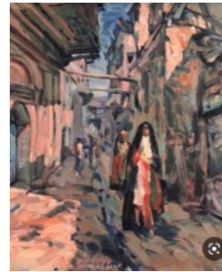
شكل (٩) لوحة للفنان لوثر ايشو شكل (١٠) لوحتان للفنان خليف محمود