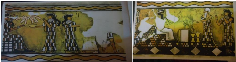
شكل (١) مشهد شجرة الحياة (من الحضارة البابلية) شكل(٢) مشهد تقديم الهدايا(من الحضارة البابلية)