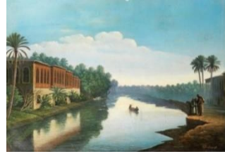
شكل (٤) لوحة زيارة للفنان (اسماعيل الشبخلي)