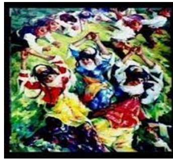
شكل (١٢ و ١١) لوحتان للفنان نجيب يونس