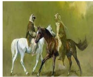
شكل (٥) لوحة للفنان (فائق حسن) شكل (٦) لوحة للفنان (حافظ الدروبي)